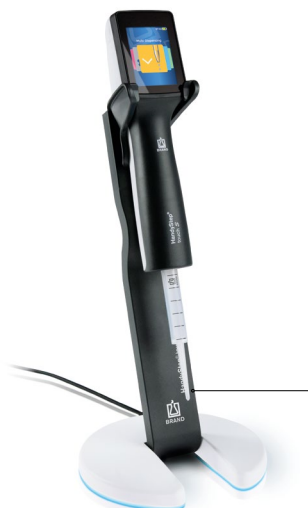
充电支架与HandyStep® touch S 以及 PD-Tip //