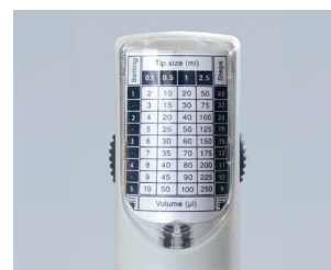
通过背后的量程检索表快速选 择体积