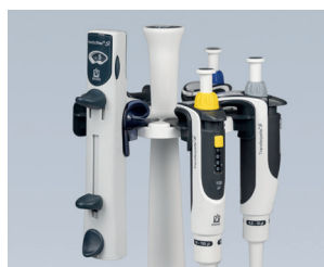
挂架同样适合Transferpette® S 桌面移液器架